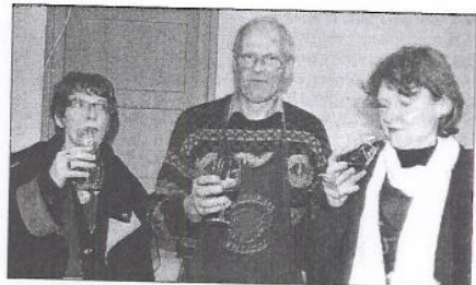
«Un millésime assez friand»