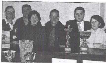
La remise des coupes