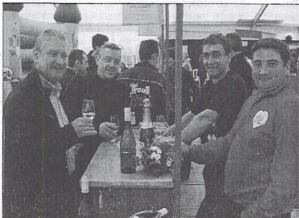
On vient en ami pour découvrir les beaujolais

Salon des Sarmementelles, de 10 h à 18 h, entrée 2 €, 3 € avec le verre.